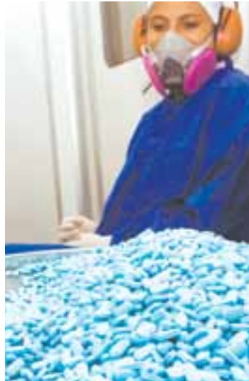
Produção nacional de genéricos