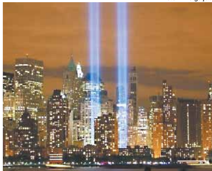
Vista noturna da área onde ficavam as torres gêmeas do WTC, em Nova York