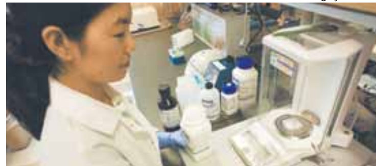
Pesquisadora da ImQuest BioSciences trabalha no novo papel filme