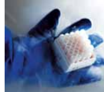
Amostras em tanque de refrigeração