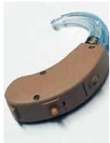
O aparelho ganhou o nome de Manaus