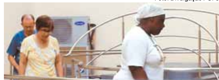
Pacientes de Parkinson participam de tratamento fisioterápico