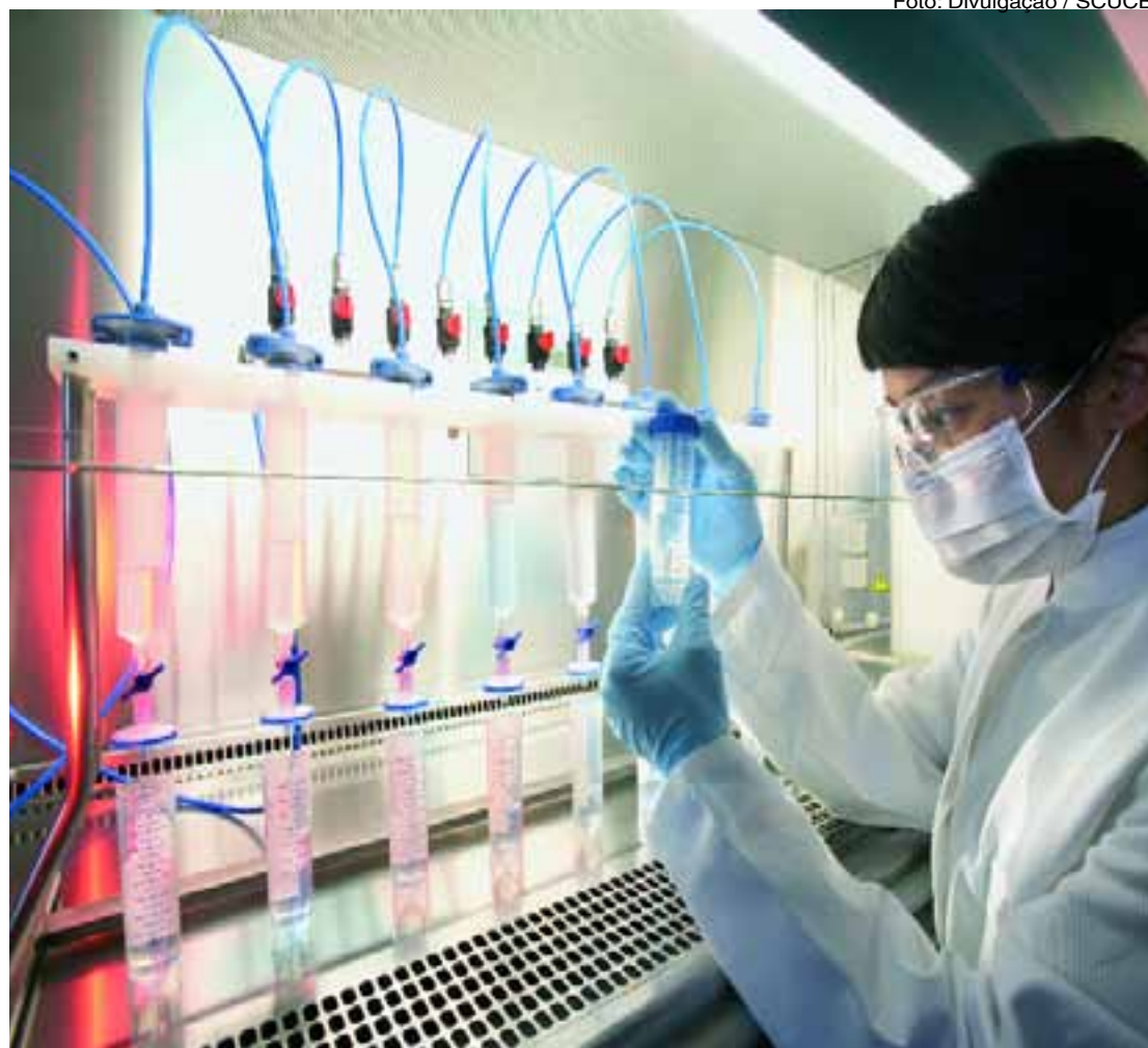
Cientista analisa amostras de material utilizado em pesquisa genética, em Universidade dos EUA