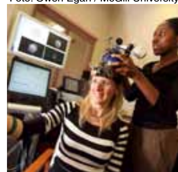
Paciente durante EMT