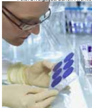
Pesquisadora analisa amostras